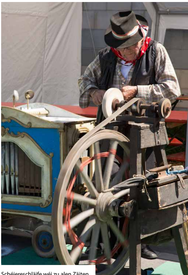
Schéiereschläife wéi zu alen Zäiten