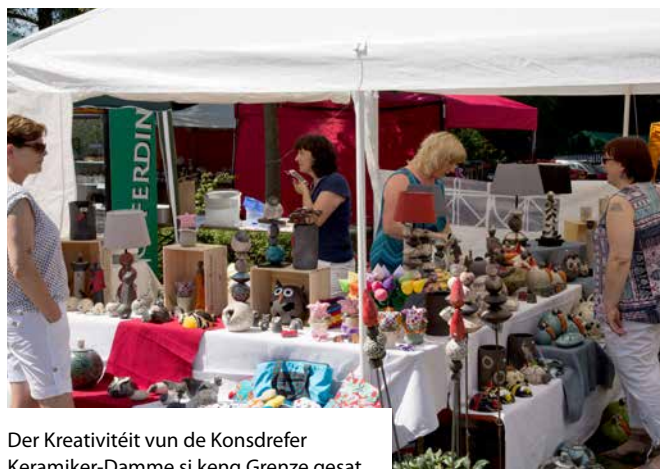
Der Kreativitéit vun de Konsdrefer Keramiker-Damme si keng Grenze gesat