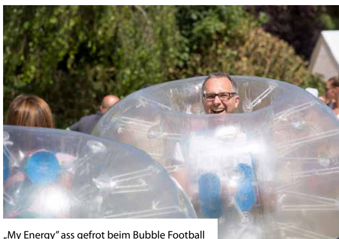
„My Energy“ ass gefrot beim Bubble Football