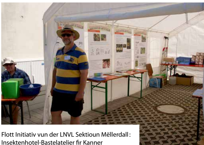
Flott Initiativ vun der LNVL Sektoun Mëllerdall: Insektenhotel-Bastelatelier fir Kanner