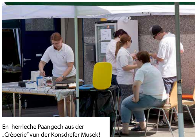
En herrleche Paangech aus der „Crêperie“ vun der Konsdrefer Musek!