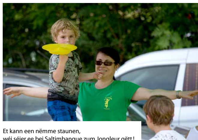
Et kann een nëmme staunen, wéi séier ee bei Saltimbanque zum Jongleur gëtt!