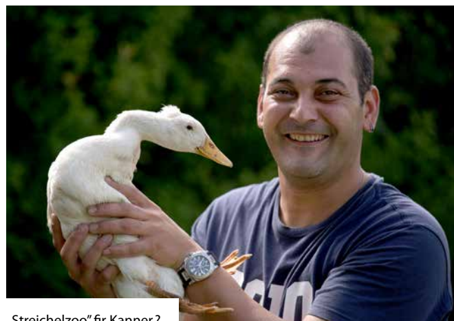
„Streichelzoo“ fir Kanner?