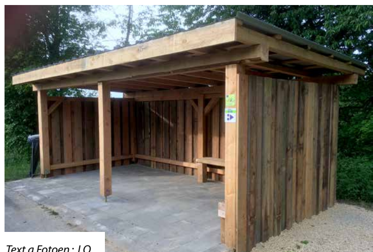
Text a Fotoen: J.O.