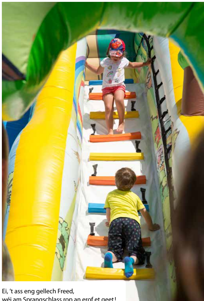
Ei, 't ass eng gellech Freed, wéi am Sprangschlass rop an erof et geet!