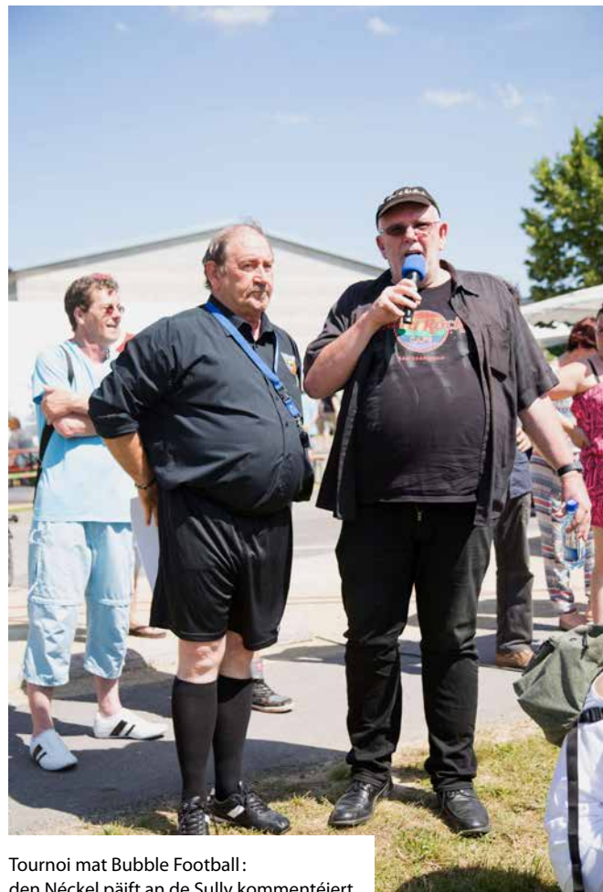
Tournoi mat Bubble Football: den Néckel päift an de Sully kommentéiert