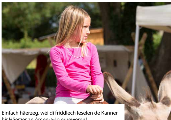
Einfach häerzeg, wéi di friddlech leselen de Kanner hir Häerzer an Amen-a-Jo erueweren!