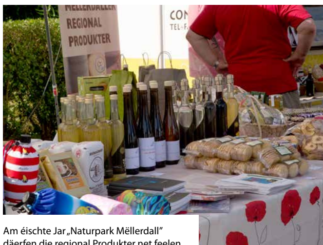
Am éischte Jar „Naturpark Mëllerdall“ dierfen die regional Produkter net feelen