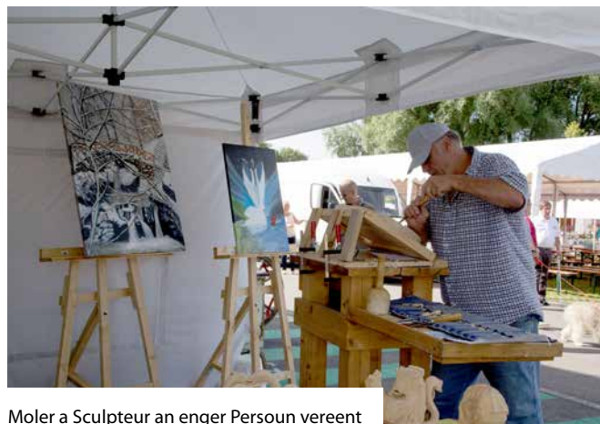
Moler a Sculpteur an enger Persoun vereent