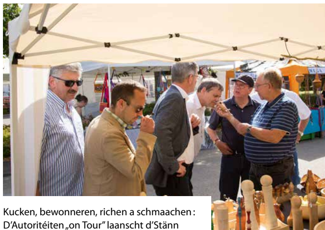
Kucken, bewonneren, richen a schmaachen: D'Autoritéiten „on Tour“ laanscht d'Stänn