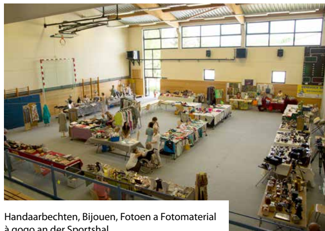
Handaarbechten, Bijouen, Fotoen a Fotomaterial à gogo an der Sportshal