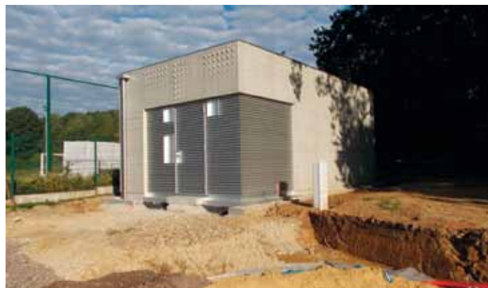
(Text : POST Luxembourg ; Foto : Jean Bonert)

Ces bâtiments réalisés avec des éléments de façade préfabriqués sont destinés à héberger les équipements de télécommunications nécessaires pour raccorder à l'avenir les clients des localités environnantes à la fibre optique.