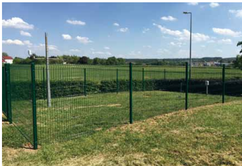
(Text: Roby Alfter)

D'Wiederstatioun Konsdref ass zanter dem 27. November 2014 a Betrib.