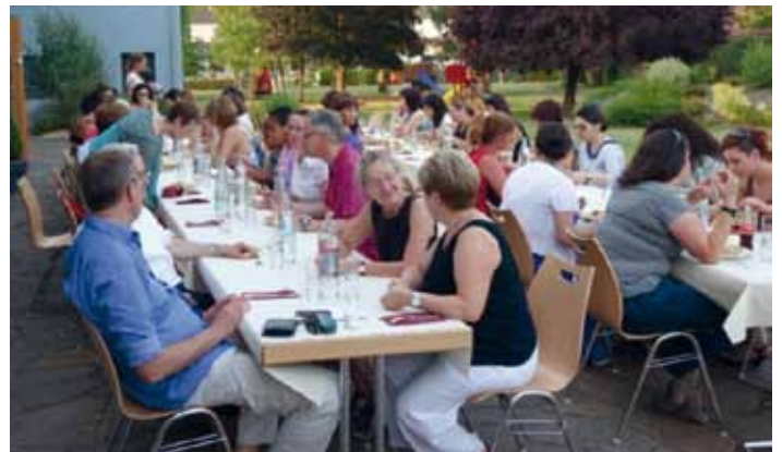
(Text a Fotoen : MEC a.s.b.l.)